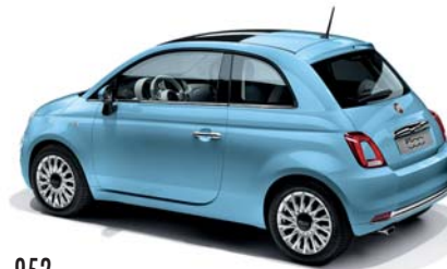
952 AZZURRO VOLARE