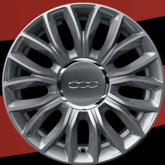
73Z - CERCHI IN LEGA 15" argento lucido