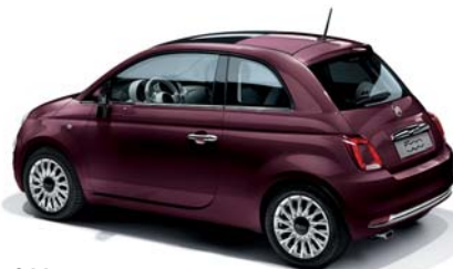
866 BORDEAUX OPERA