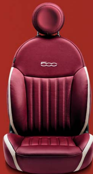
POP - LOUNGE (OPTIONAL) 861

Pelle Frau Nera con inserti in pelle color avorio. Poggiatesta in pelle nera. Logo 500 ricamato a contrasto in colore avorio.