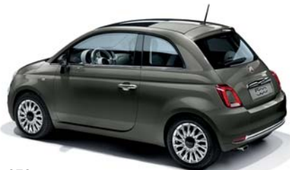
372 GRIGIO COLOSSEO