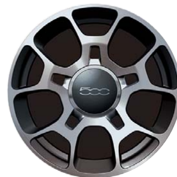
Sport diamantati a 5 razze