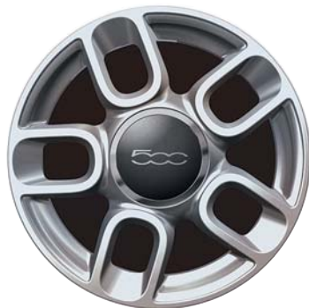
Sport a 5 razze