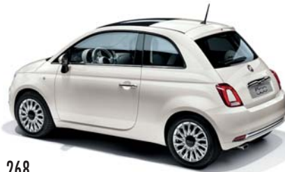
268 BIANCO GELATO