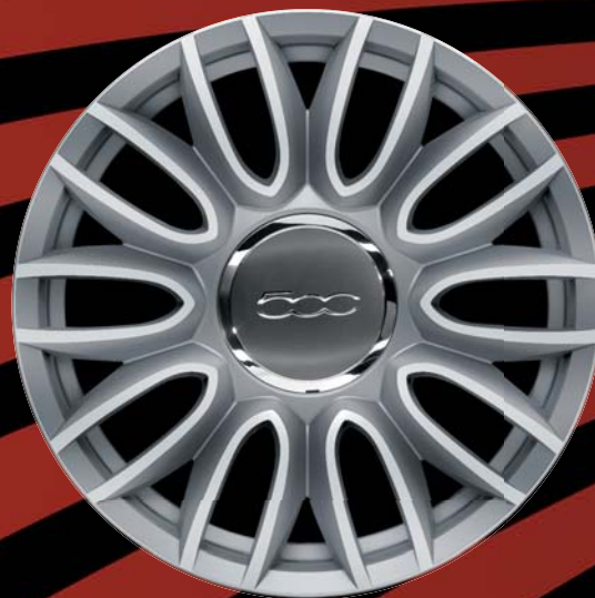
74A - CERCHI IN LEGA 16" grigio lucido diamantato