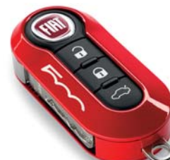
Kit rosso corallo e fantasia chevron