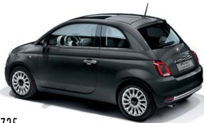
735 GRIGIO CARRARA