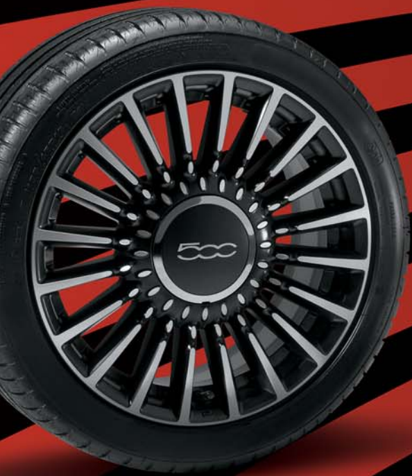
5ZZ - CERCHI IN LEGA 16" nero opaco diamantato