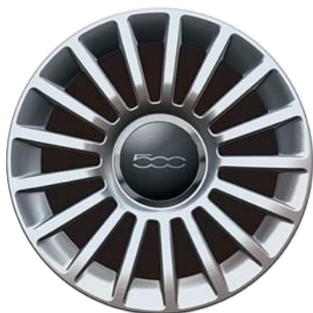
A 17 razze