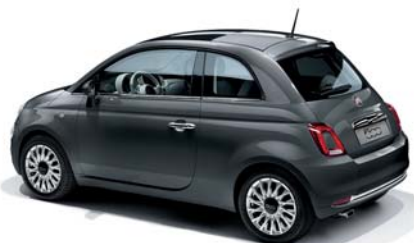
695 GRIGIO POMPEI