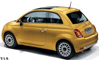
712 GIALLO SOLE