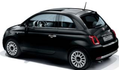
876 NERO VESUVIO