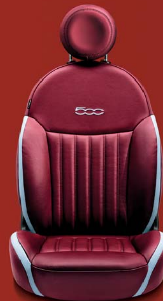
POP - LOUNGE (OPTIONAL) 688

Pelle Frau Bordeaux con inserti in pelle color avorio. Poggiatesta in pelle Bordeaux. Logo 500 ricamato a contrasto in colore avorio.