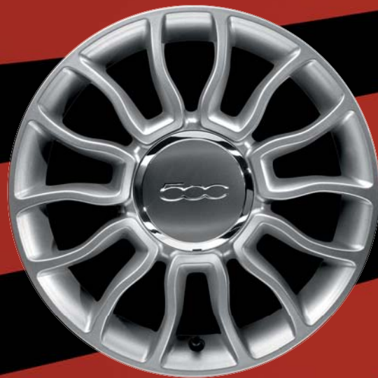
4WQ - CERCHI N LEGA 15" argento lucido