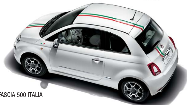
FASCIA 500 ITALIA