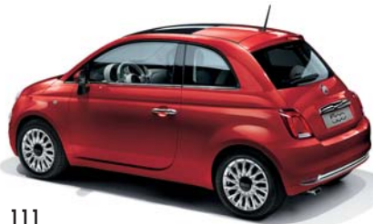
111 ROSSO PASSIONE