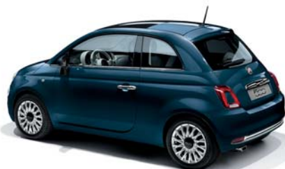
687 BLU DIPINTO DI BLU