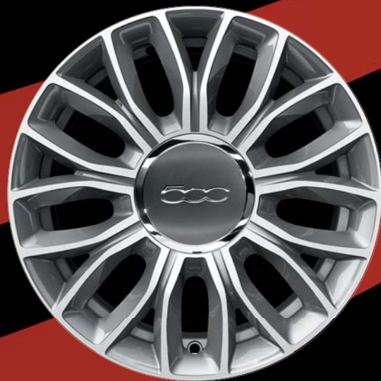
5YN - CERCHI IN LEGA 15" grigio diamantato