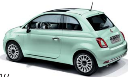
166 VERDE LATTEMENTA