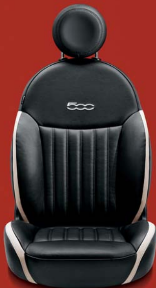
POP - LOUNGE (OPTIONAL) 686/687

Logo ricamato a contrasto in color corallo.