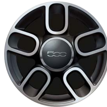
Sport bicolore diamantati a 5 razze