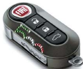
Swarovski con logo 500