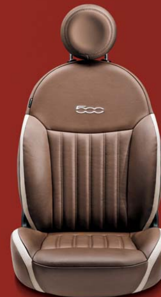
POP - LOUNGE (OPTIONAL) 461

Pelle Frau Bordeaux con inserti in pelle color azzurro. Poggiatesta in pelle Bordeaux. Logo 500 ricamato a contrasto in colore azzurro.