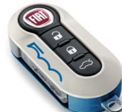
Kit bianco e blu Italy - bianco e verde militare