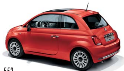
552 ROSSO CORALLO