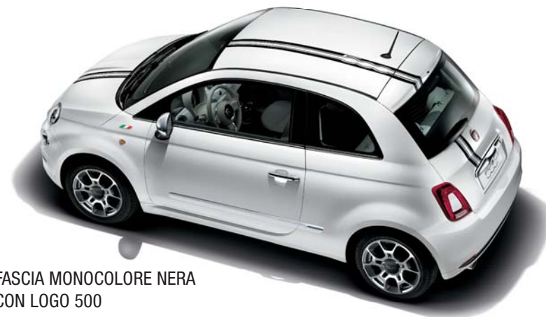
FASCIA MONOCOLORE NERA CON LOGO 500