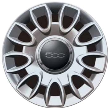
A 9 razze doppie