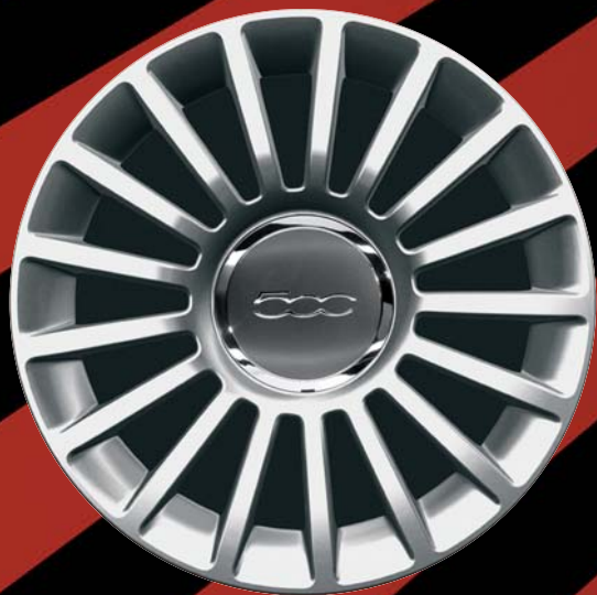
435 - CERCHI IN LEGA 16" argento lucido