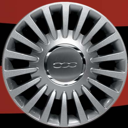
431 - CERCHI IN LEGA 15" argento lucido