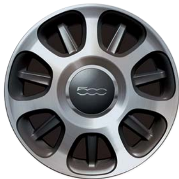
Diamantati a 7 razze