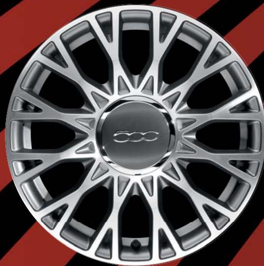
5EQ - CERCHI IN LEGA 16" antracite opaco diamantato