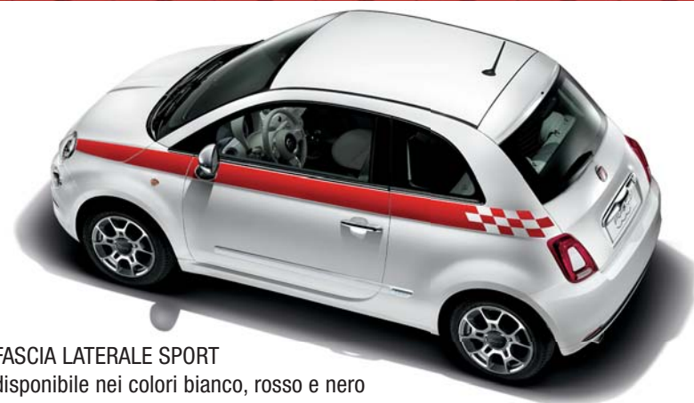
FASCIA LATERALE SPORT disponibile nei colori bianco, rosso e nero