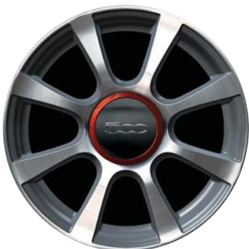
A 8 razze