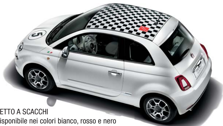
TETTO A SCACCHI disponibile nei colori bianco, rosso e nero

Sticker carrozzeria, key cover per le chiavi, badge laterali, make-up holder, cerchi: chi vuole esprimere la propria fantasia ha a disposizione tutto quello che desidera per mettere la propria firma su un oggetto di design e renderlo un vero pezzo unico.