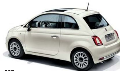
227 BIANCO GHIACCIO