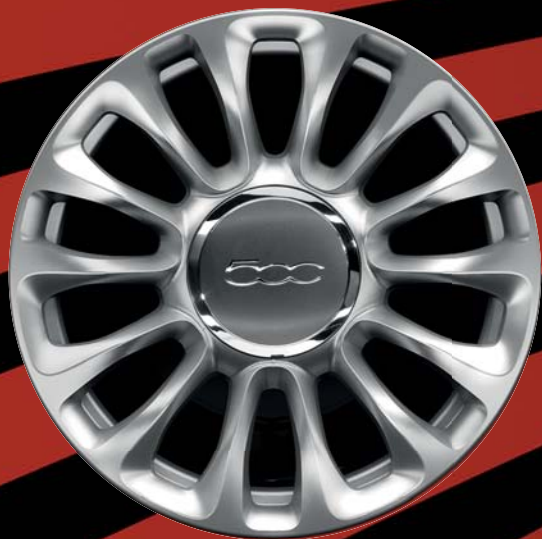
6U4 - CERCHI IN LEGA 15" argento lucido